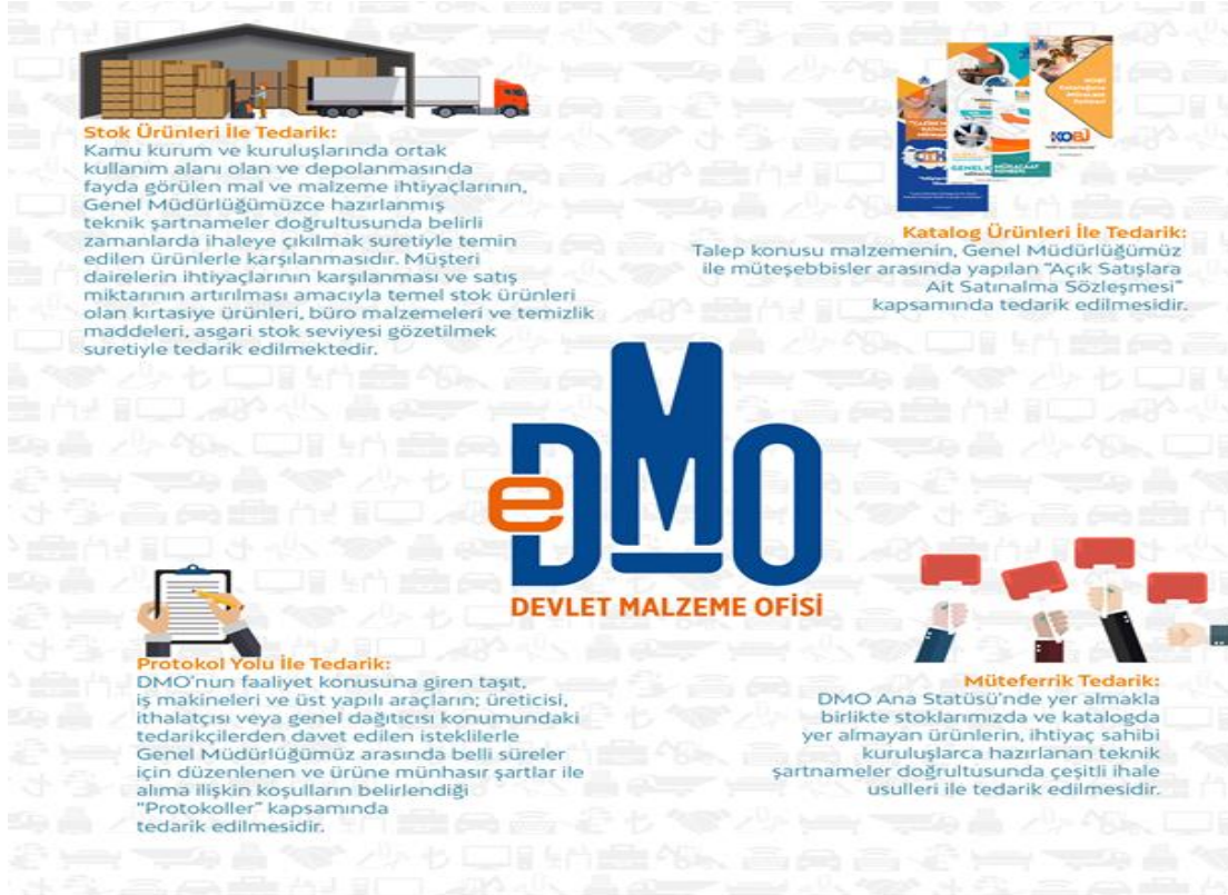
Şekil 1 : DMO Tedarik Yöntemlerine İlişkin Tanıtıcı Görsel