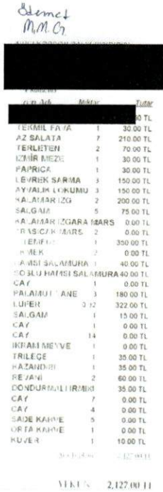
Görsel 5: Restoran Harcamasını Gösteren Fiş