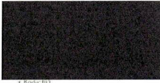
Görsel 5: Restoran Harcamasını Gösteren Fiş