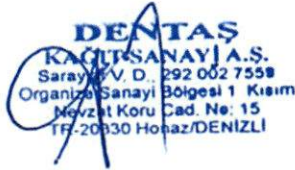
Görsel 4: Yakıt Harcamasına İlişkin Doküman