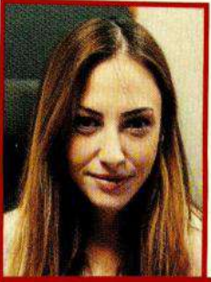
İmren Kol Rekabet Kurumu IV DUD Daire Başkan Yrd. V.

Yok edici/öldürücü devralmalar büyük ölçekli teşebbüslerin gelecekte kendisine rakip olabilecek ve sahip olduğu pazar gücü için tehdit olabilecekleri engellemeyi amaçlıyor.